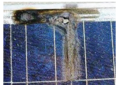
Elimina puntos calientes