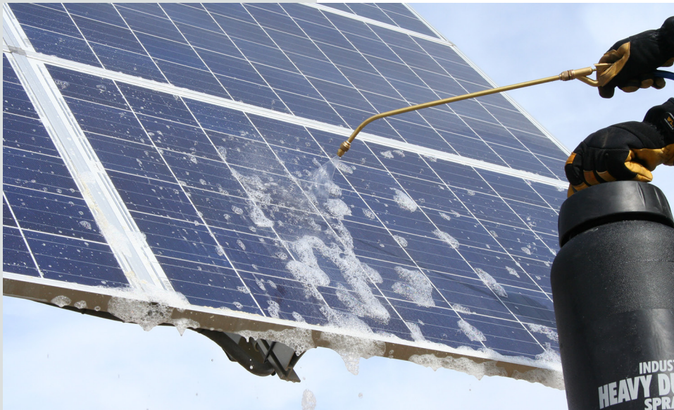
SPW de Polywater rociado en un panel FV

Un efectivo, seguro y económico limpiador para instalaciones de paneles FV.