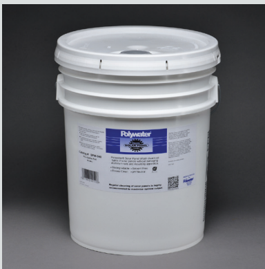
Balde de 18.9 Lt.