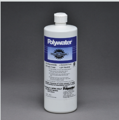
Botella de 0.95 Lt.